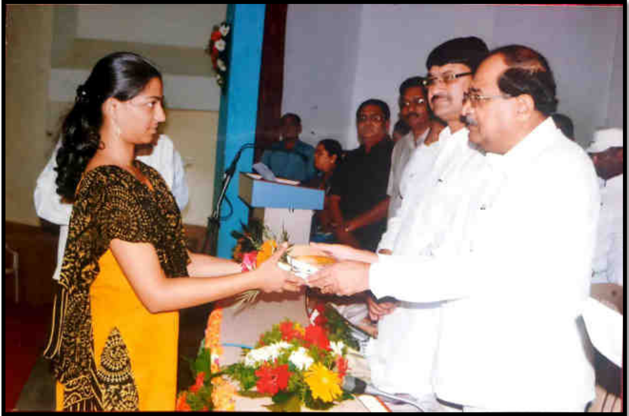
Felicitation of wards with the hands of Hon'ble Chairman of PRES