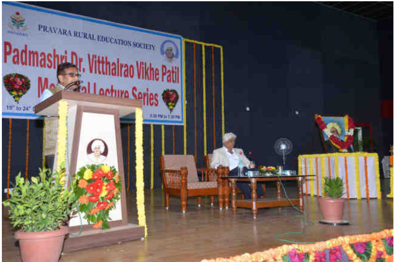
Hon'ble Shri. Ramakantji Khalap, Former Union Minister, Gov. India, as a speaker